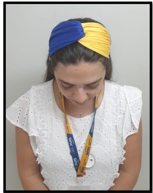
Figura 1 – Avental de peito com personalização da marca adequado; Figura 2 - Dolmã de evento com ajustes e reforços dos botões de pressão em qualidade e resistência; Figura 3 – Dolmã e avental em adequação; Figuras 4 e 5 – Faixa turbante Nutricionista em adequação;

Atenciosamente, Sabrina Alves Batista Gerente de Área