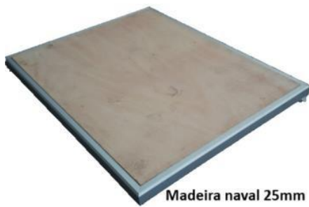
Madeira naval 25mm